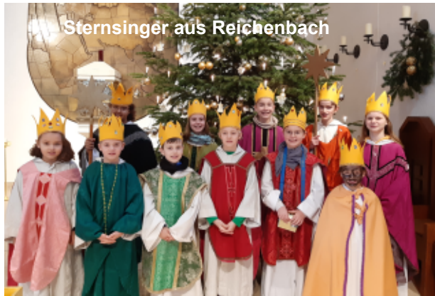
Sternsinger aus Reichenbach