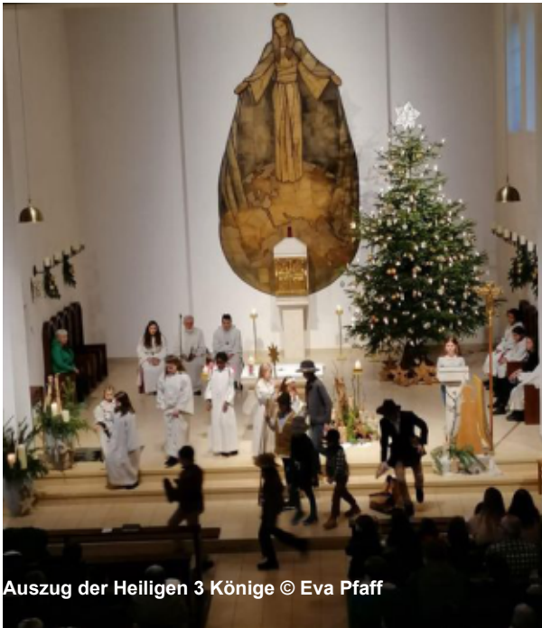
Auszug der Heiligen 3 Könige

Das Krippenspiel an Heilig Abend in Reichenbach war wieder ein voller Erfolg. Die Kinder, größtenteils aus Reichenbach und einige Kommunionkinder aus anderen Ortsteilen haben die Geschichte von der Geburt Christi, die vor über 2000 Jahren stattfand, großartig vor einer vollen Kirche gespielt. Wir hoffen auf genauso gelungenen Aufführungen in den nächsten Jahren, zu denen natürlich alle Kinder herzlich eingeladen sind.