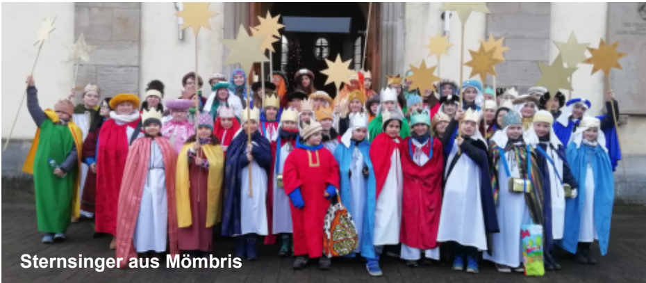
Sternsinger aus Mömbris