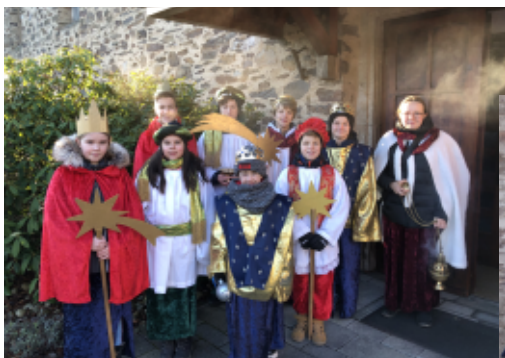
links: Sternsinger aus Daxberg unten: Sternsinger aus Hemsbach