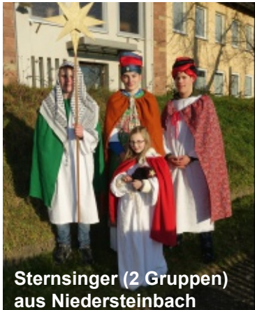
Sternsinger (2 Gruppen) aus Niedersteinbach