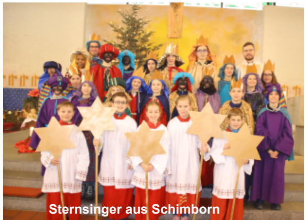
Sternsinger aus Schimborn