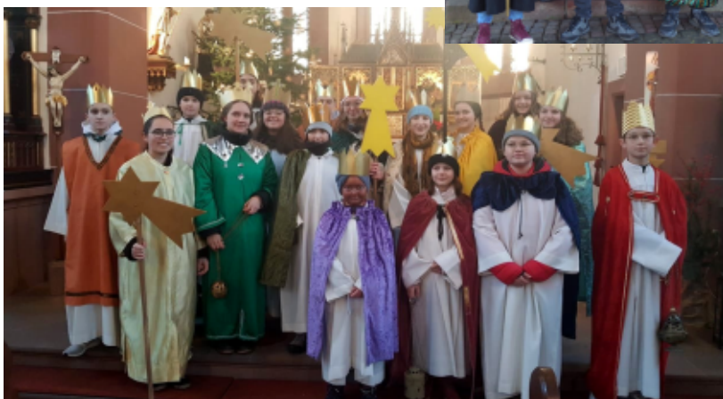
oben: Sternsinger aus Gunzenbach